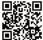
포항 일본인 가옥거리