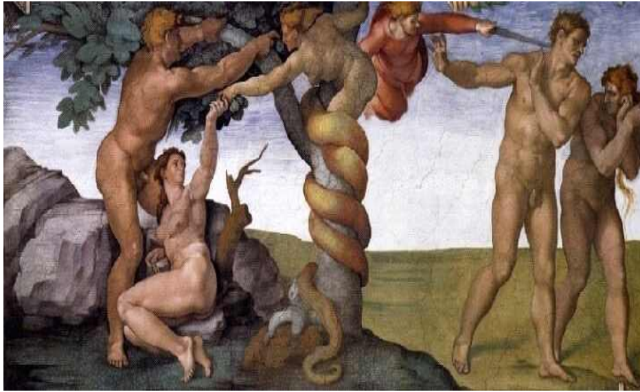
[사진 5] 선악과로 인해 낙원에서 추방당하는 아담과 이브

이후에는 아담과 이브는 낙원에서 쫓겨나게 된다. 이러한 모습은 앞으로의 인류의 모습을 나타내는 것이라고 생각이 든다.