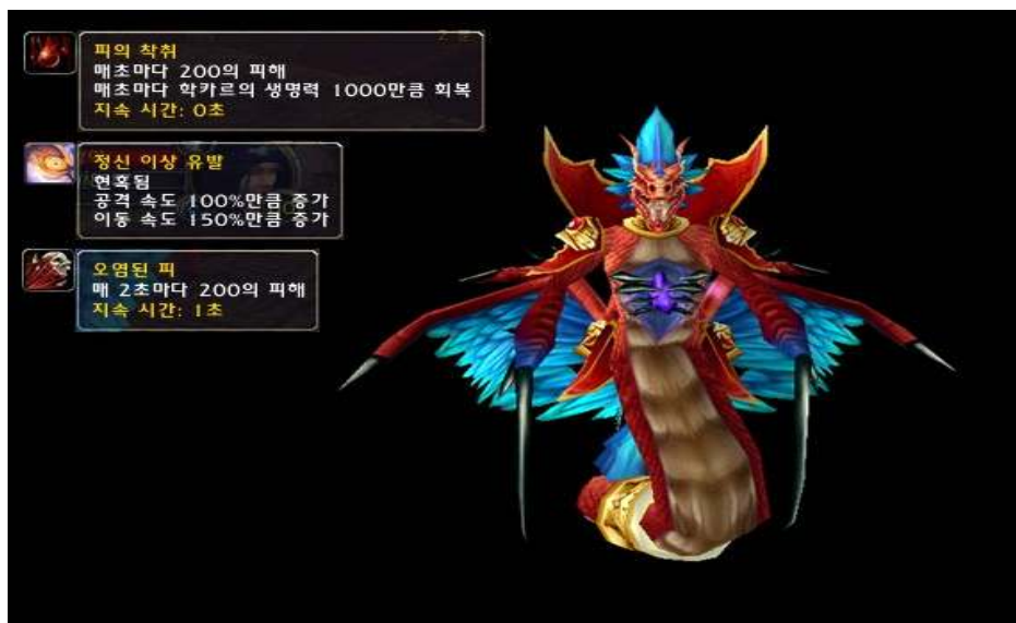
[사진 2] 오염된피사건의 근원 학카르

이 던전의 보스인 학카르는 플레이어들에게 시간이 지남에 따라 점점 체력이 손실되는 디버프가 발생하는 "오염된 피"라는 기술을 이용했다.