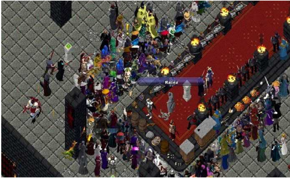
[사진 1] 울티마 온라인 플레이 화면

물론 이뿐만이 아니다. 개인이 금전적인 목적을 가지고 슬라임을 버그로 대거 생성해 수많은 유저들을 학살한 바가 있었다. 물론 이후 이 유저는 운영자에 의해 처벌을 받게 되지만 이를 처벌할 사람이 없었더라면 이런 상황이 지속되지 않았을까 싶다.